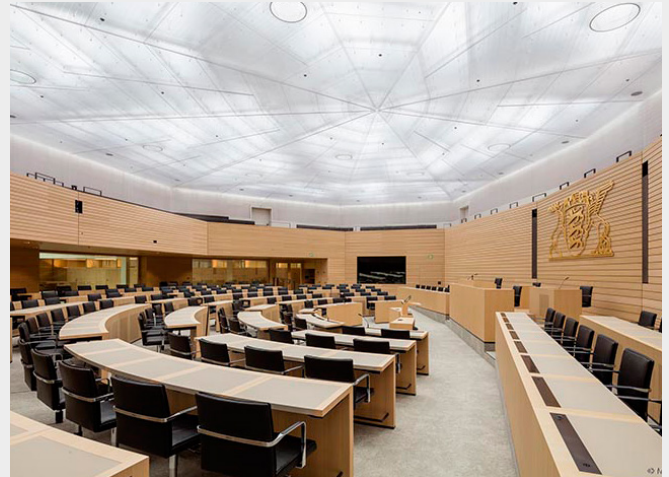
Landtag Baden-Württemberg